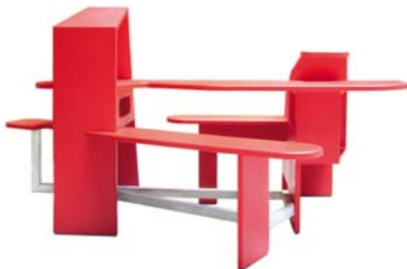
„You May“, Möbel für den öffentlichen Raum Design: Walking Chair © Walking Chair

Die Ausstellung, die im Rahmen der 4. Vienna Design Week eröffnet wird, stellt die wichtigsten ProduktdesignerInnen dieser neuen Generation vor, unter ihnen etablierte Namen wie E00S, Walking Chair oder Polka, aber auch jüngere wie Marco Dessi oder Dottings. Erstmals werden die Design-Highlights des vergangenen Jahrzehnts in einer Zusammenschau präsentiert – mit den Klassikern von morgen.