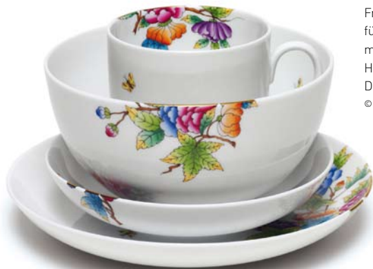
Frühstücksset für die Porzellan- manufaktur Herend Design: Polka © Polka

Design führte in Wien lange Zeit ein Schattendasein. Doch seit den späten 1990er Jahren hat sich eine kreative Szene etabliert, die mittlerweile auch international wahrgenommen wird. Traditionsunternehmen wie Lobmeyr oder Augarten suchen die Zusammenarbeit mit jungen Gestalterinnen und Gestaltern, auch die Stadt hat das Potenzial erkannt und setzt auf Design als Marke und Wirtschaftsfaktor.