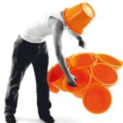
Aufbewahrungssystem „Samsa Bucket“ · Design: Breaded Escalope © Breaded Escalope