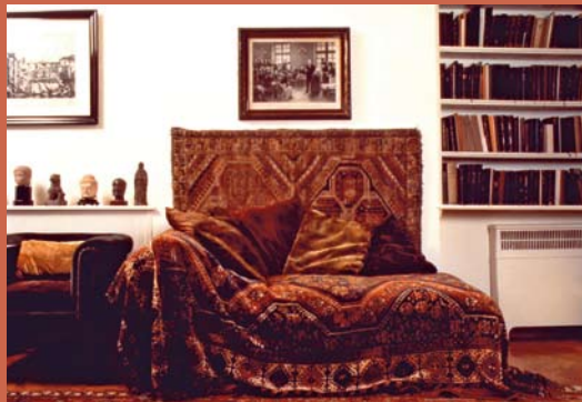
Couch in Sigmund Freuds Praxis

Ob es um die Planung von Nervenheilanstalten oder das Porträtieren von Patientinnen und Patienten ging: Es scheint, als hätten das „Verrückte“ und der „Wahnsinn“ eine geradezu magische Anziehungskraft besessen. Die Ausstellung „Madness & Modernity“ wurde für die Wellcome Collection in London konzipiert – ein Museum, das Medizingeschichte in einen breiteren kulturellen Kontext einbettet. Sie bietet somit einen – mitunter auch kontroversiellen – Blick von außen auf ein spezifisches Phänomen der Wiener Kultur. „Madness & Modernity“ beleuchtet die Beziehungen zwischen Psychiatrie und bildender Kunst, Architektur und Design und zeigt zugleich, wie stark die Moderne unsere Einstellung gegenüber psychischen Erkrankungen geprägt hat.