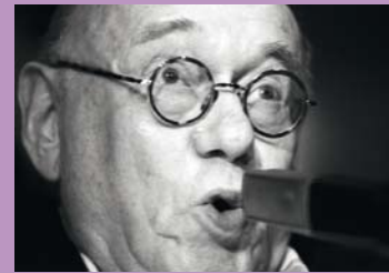
Ernst Jandl bei einer Lesung in Darmstadt 1997

Mit seinen Laut- und Sprechgedichten wurde Ernst Jandl (1925 – 2000) berühmt. Doch der experimentelle Dichter war auch ein Auftritts- und Vortragskünstler, der das Publikum zum Lachen, manchmal zum Toben brachte. Jandl schrieb im Dialekt, auf Englisch und in „heruntergekommener“ Sprache.