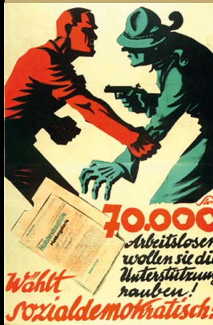
Victor Theodor Slama, Wahlplakat, 1930

Ein Zeitgeschichte- und Kulturpanorama jener entscheidenden Jahre, als die Zukunft der jungen Republik auf der Kippe stand – zwischen Demokratie und Diktatur, Aufbruch und Resignation.