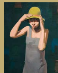
Herbert Ploberger Vor dem Schaufenster, 1928 Öl auf Holz