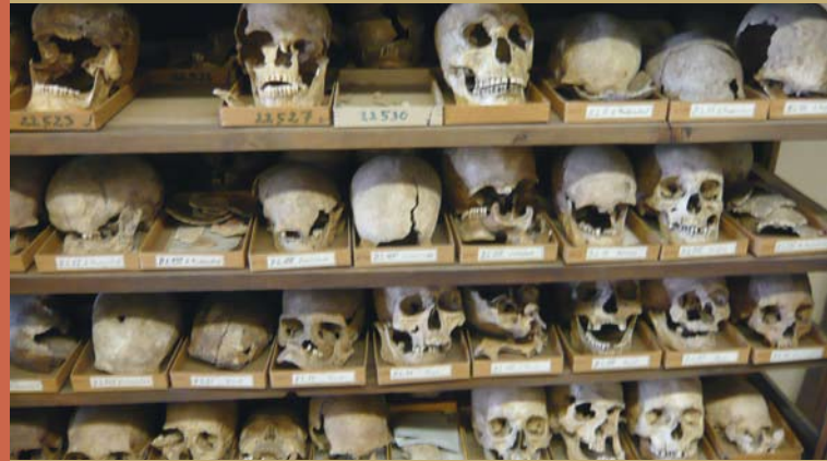
Totenschädel aus der Anthropologischen Sammlung des Naturhistorischen Museums Wien, 2007